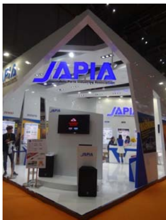
< J A P I Aブース外観 >