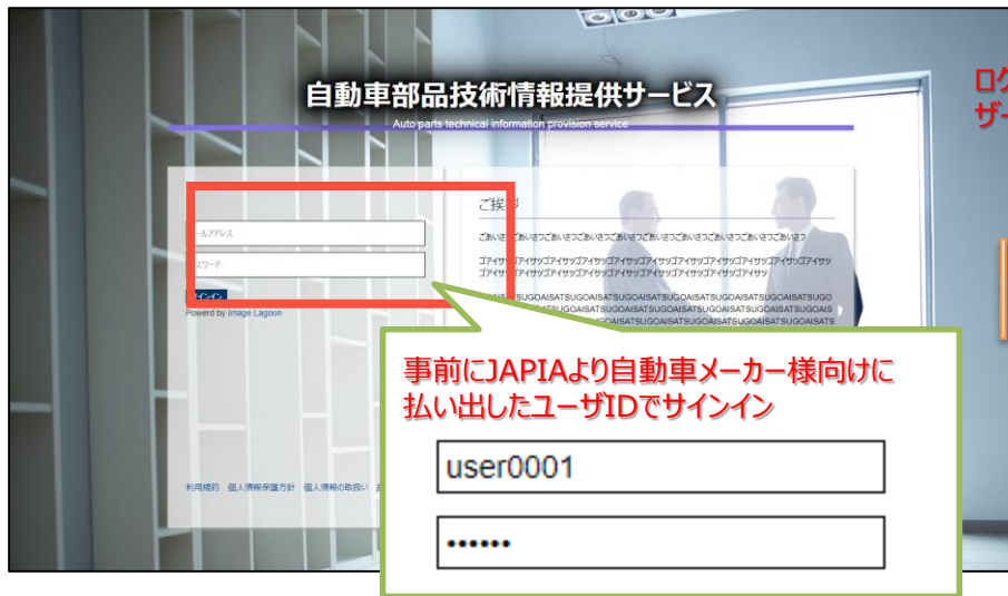
画面イメージ（サインイン）