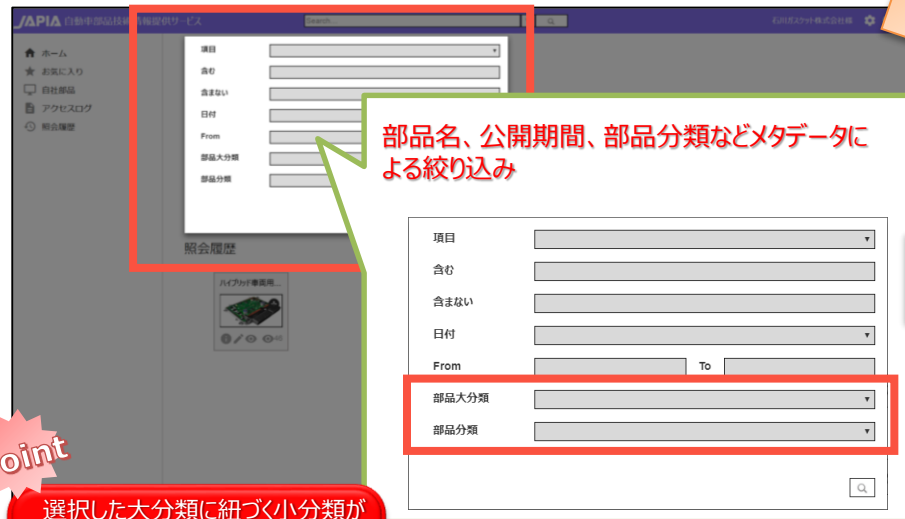
画面イメージ（部品の検索条件を入力）