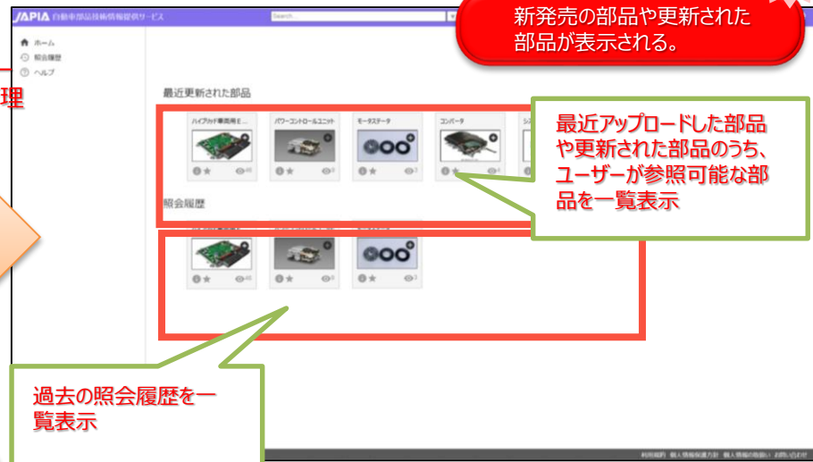
画面イメージ（ホーム画面）